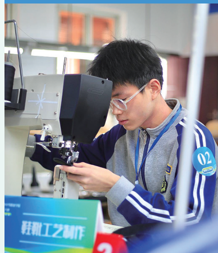
2023年市学生职业技能大赛。

势,我市将深化共建“姊妹校”等中外合作办学实践,包括中-意、中-德职业教育园建设,推进巴西、智利、南非等“丝路学院”项目等,同时支持开展中职国际“3+2”“3+4”和高职国际“专升本”“专升硕”试点。到2025年,力争每年培养100名左右国际职业硕本专科生,建成“丝路学院”5个以上,中-意职业教育园成为省职业教育新标杆。