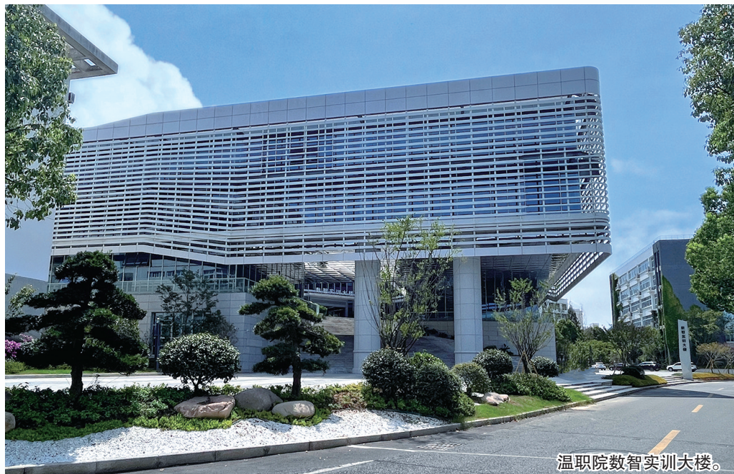
温州职院数智实训大楼。

不仅如此,在职业教育愈发受关注和重视的当下,我市职业教育将目光落在每一个人身上,以“人人出彩”为目标,通过纵向贯通、职普融通、育训结合等方式,不断拓宽学生的成才路,让他们就业有能力、升学有优势、发展有通道、成功有榜样,享受更出彩的人生。